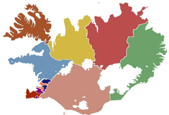
Skipulag heilbrigðiseftirlits sveitarfélaga